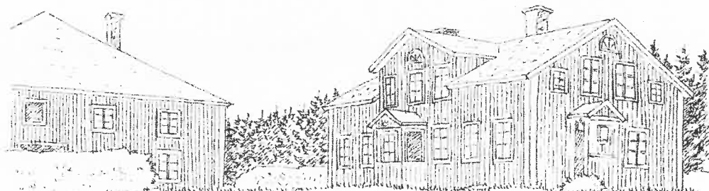
Jorisgården i Lindsjön, Hassela